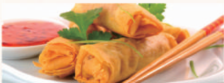
Met nasi of bami i.p.v. witte rijst € 1,80 extra Met mihoen of chau mie i.p.v. witte rijst € 5,80 extra