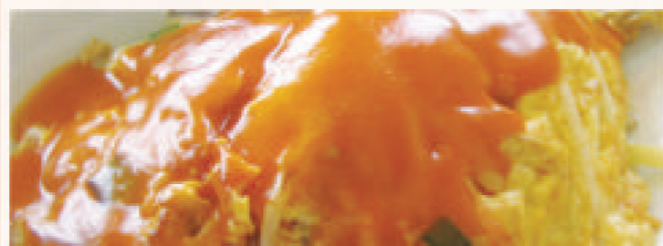
Met nasi of bami i.p.v. witte rijst € 1,80 extra Met mihoen of chau mie i.p.v. witte rijst € 5,80 extra