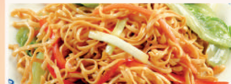
Met nasi of bami i.p.v. witte rijst € 1,80 extra Met mihoen of chau mie i.p.v. witte rijst € 5,80 extra