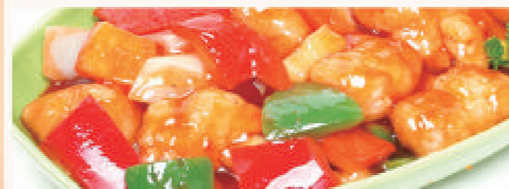
Met nasi of bami i.p.v. witte rijst € 1,80 extra Met mihoen of chau mie i.p.v. witte rijst € 5,80 extra